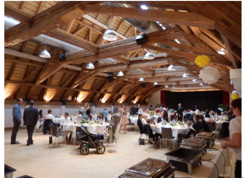
Ehemaliger Sennhof, umgebaut zum Bürgerhaus mit zwei Geschossen, barrierefrei